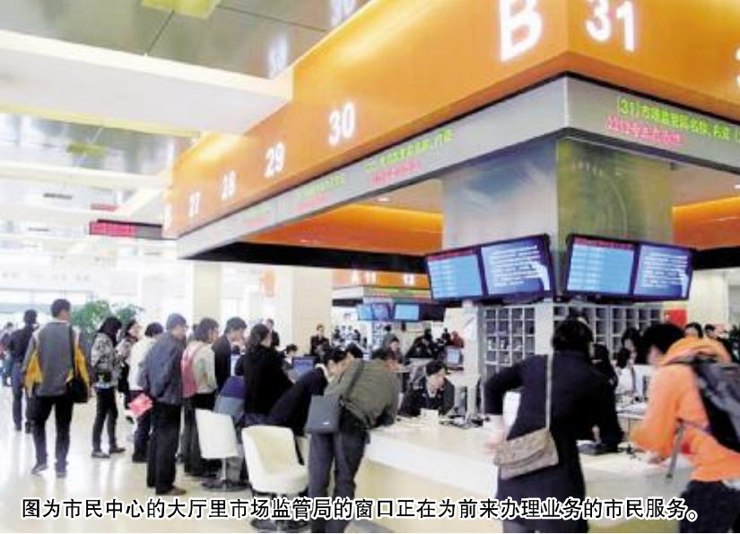
图为市民中心的大厅里市场监管局的窗口正在为前来办理业务的市民服务。