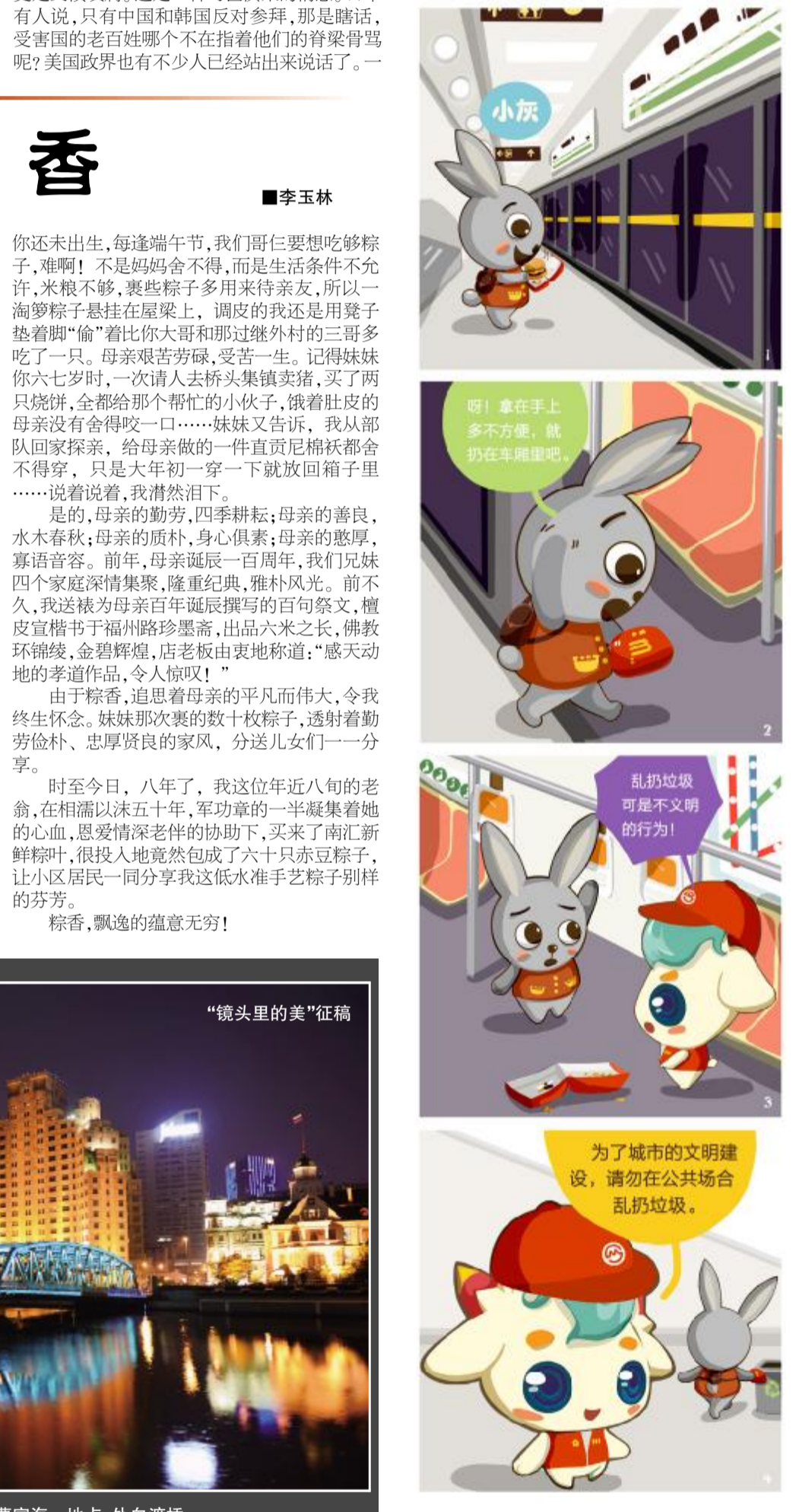
以上漫画由凉城新村街道供稿 更多内容欢迎关注“宜居凉城”微信公众号