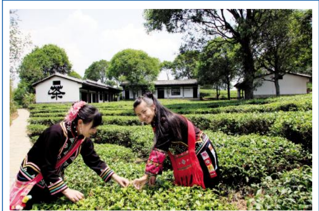
采茶忙 第288期 北外滩