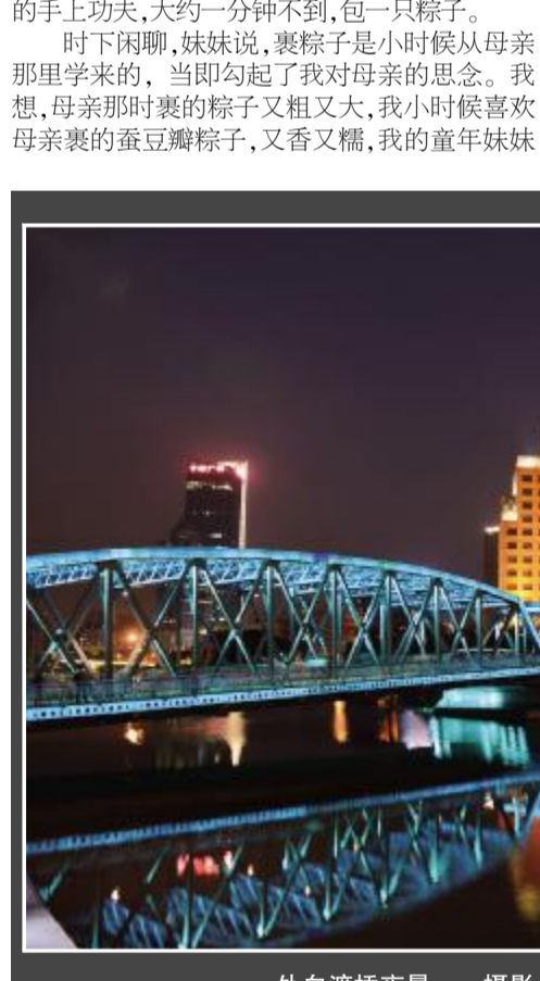
以上漫画由凉城新村街道供稿 更多内容欢迎关注“宜居凉城”微信公众号

外为凭吊而来，想到了那段难忘的历史的缘故。 在桂河大桥上，我们沿桥上的铁轨朝缅甸方向走去，正好有个西方小伙子从对面过来，互相让道。交臂擦肩之际，我忽然灵机一动，用英语向他提议，拍一张照片。对方身高约有一米八五，欣然点头同意，并马上做了一个庆幸的姿势，那憨厚的笑容非常可爱，眼神中还流露出一种善意。试想，浩浩宇宙，茫茫人海，此时此地能彼此突然相逢，难道不是一种缘分？我敢下最大的赌注，今生今世，我们不会有再相遇了。而且，我们两人可能怀着同样的情感。我在此凭吊先辈的同时，诅咒可恨的日本侵略军，给百姓、军人造成了多么大的损害。或许，他也一样。 留影之后，我们聊了几句，果然，他的父亲曾在这里历经危险和磨难，后来终于回到了祖国，而他父亲的许多战友却长眠于此。他这次就是替父亲完成心愿来的。我告诉他，家父早在1938年就在上海参加救亡运动，后投笔从戎，奔赴抗日前线。他听罢，马上伸出他那双毛茸茸的大手与我紧紧相握。 近几年，日本军国主义有所抬头，而其政府要员，频频参拜供奉有日本甲级战犯牌位的所谓“靖国神社”，引起包括中国在内的各国人民的强烈反对。过去曾遭受过日本侵略、奴役的，更是义愤填膺。这是一种与世俱来的情感。日本有人说，只有中国和韩国反对参拜，那是瞎话，受害国的老百姓哪个不在指着他们的脊梁骨骂呢？美国政界也有不少人已经站出来说话了。一