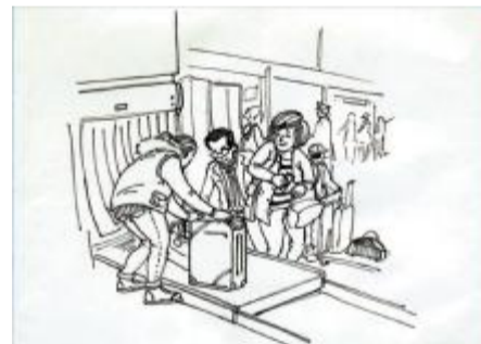
主动安检人人有责