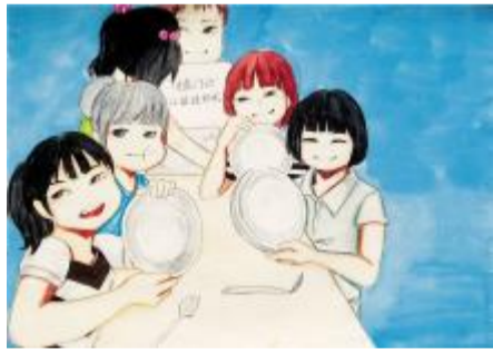
光盘行动 从娃娃抓起