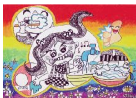
我是讲卫生的好宝宝