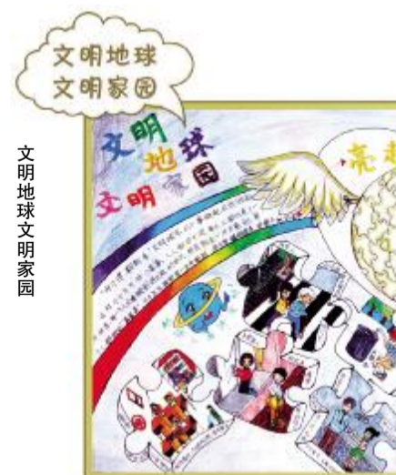
文明地球 文明家园