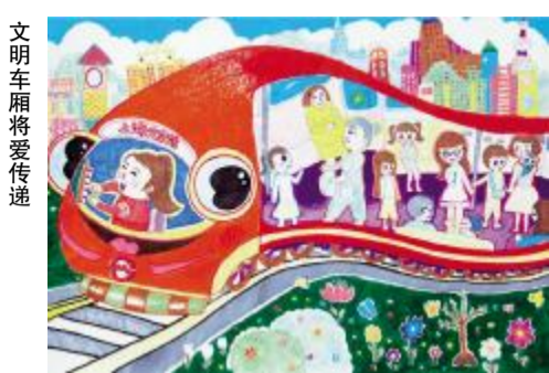
文明车厢将爱传递