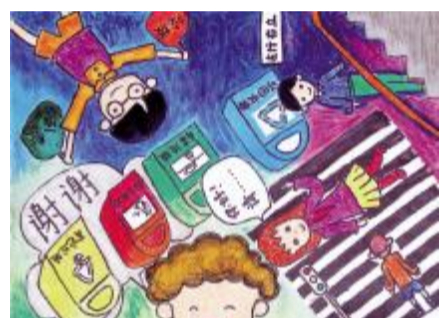
文明好习惯 大家来参加