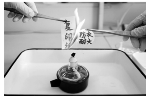
图为1月20日,科研人员在实验室内对比展示“防水耐火纸”的防火特性,左侧的普通纸张被点燃,而右侧的“防水耐火纸”完好无损