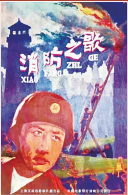
▲ 1958年,全国首部消防题材电影《消防之歌》