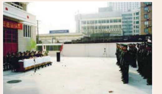
▲ 2002年2月,江湾中队回迁进驻仪式